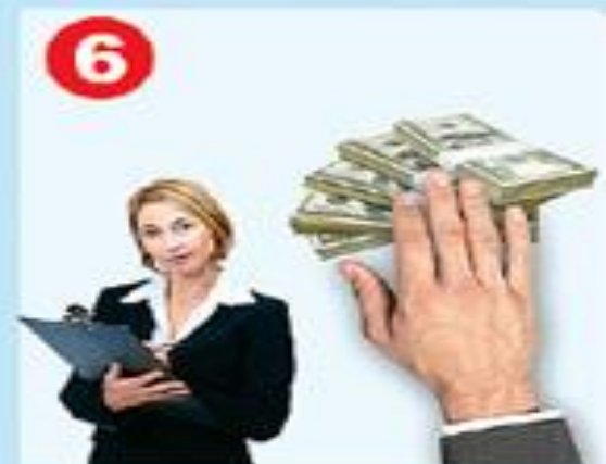
Устройство на работу