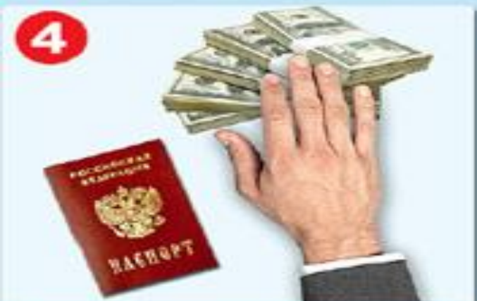
Регистрация по месту жительства, получение паспорта