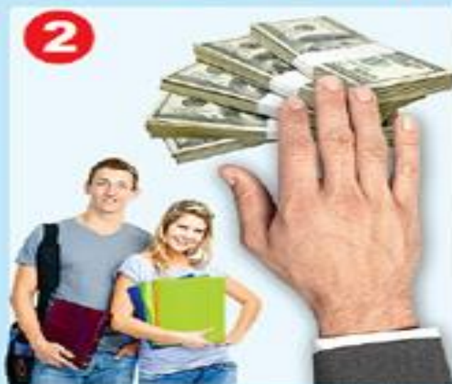
Поступление в вуз