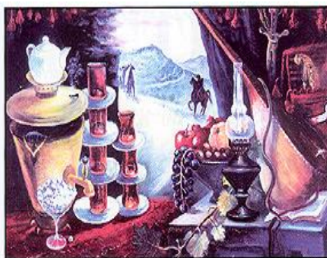
В ожидании гостей. Худ. Аскер Мамедов.