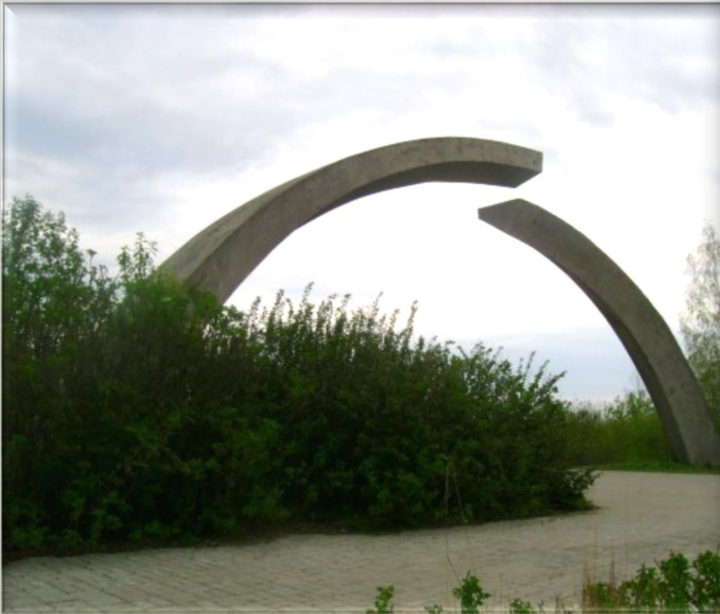
Памятник в честь разрыва блокады Ленинграда!