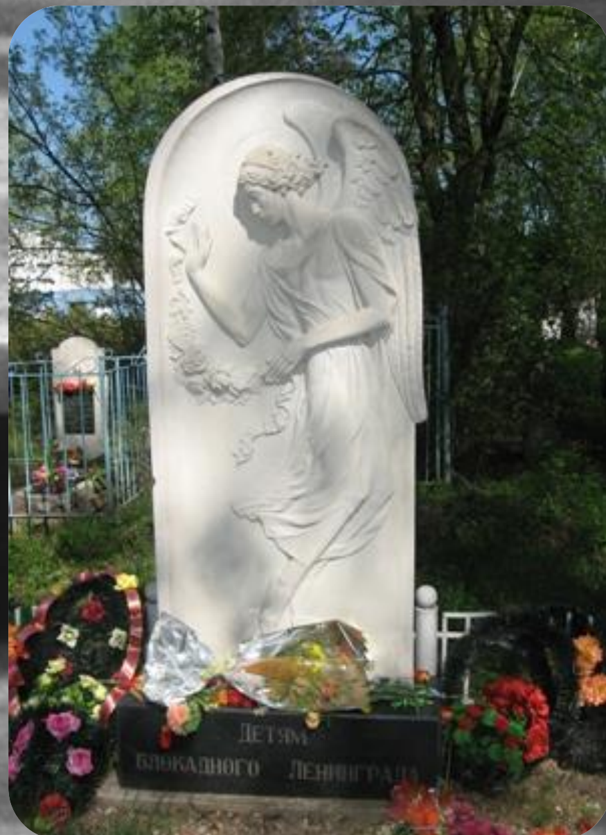
Памятник детям блокадного Ленинграда (Ярославль).