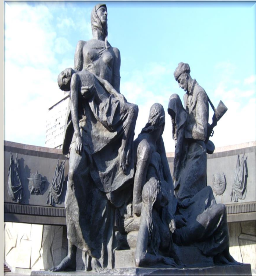
Памятник героическим защитникам блокадного Ленинграда.