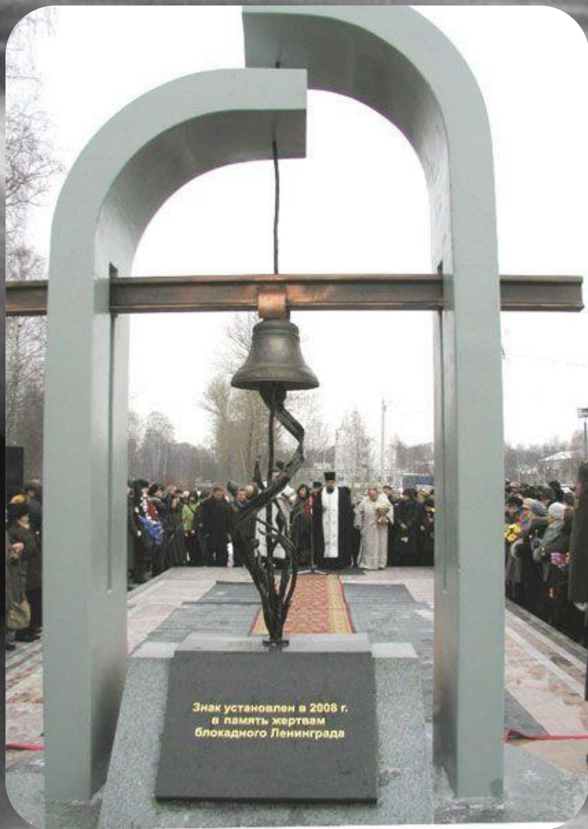
В Ярославле памятник жертвам блокадного Ленинграда.