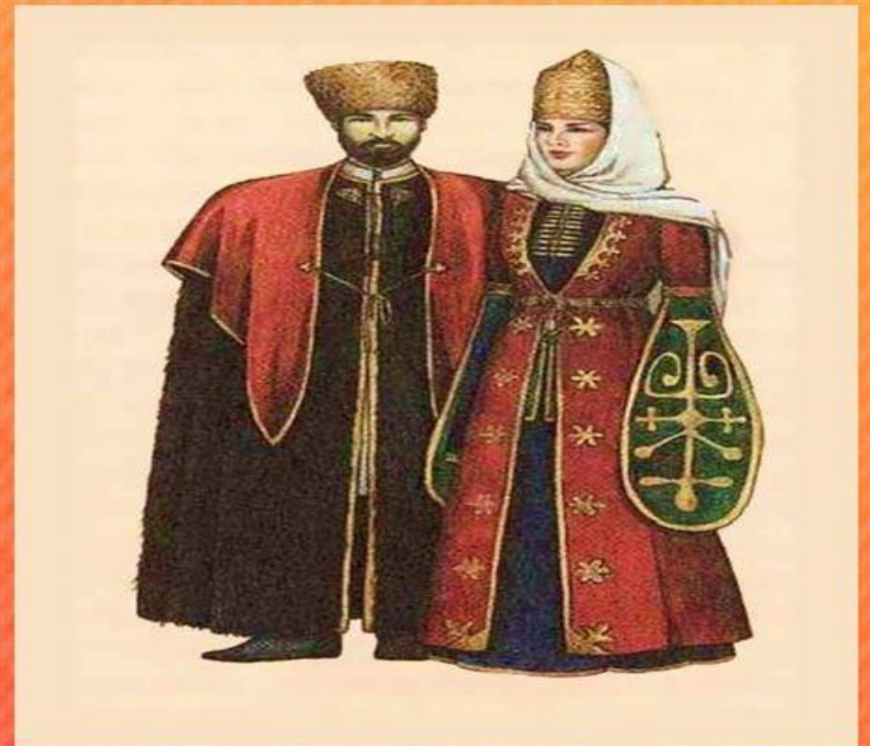
Народный костюм адыгов