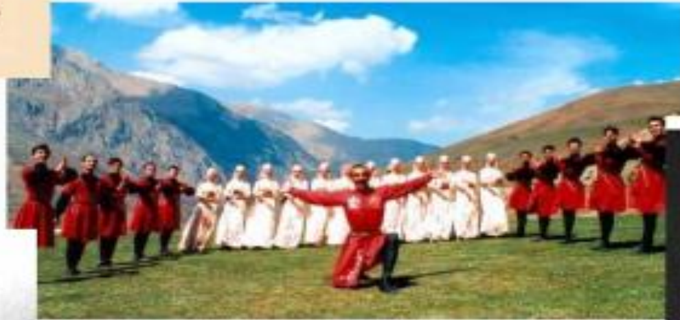
Состыма. 1983.