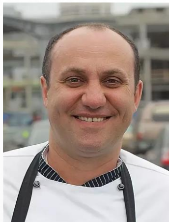
Лазерсон Илья Исаакович